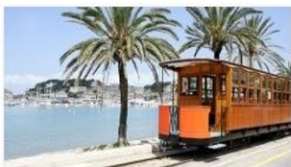
Palma de Majorka